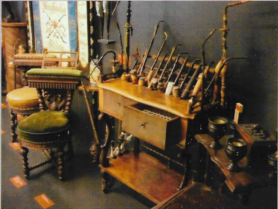
Opstelling in het Tabaksmuseum van Bünde. Zie pag. 70