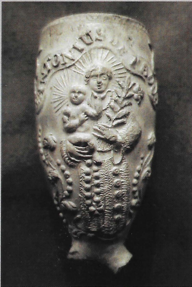
Meer over deze pijp met Sint ANTONIUS DE PADUA op pagina 66