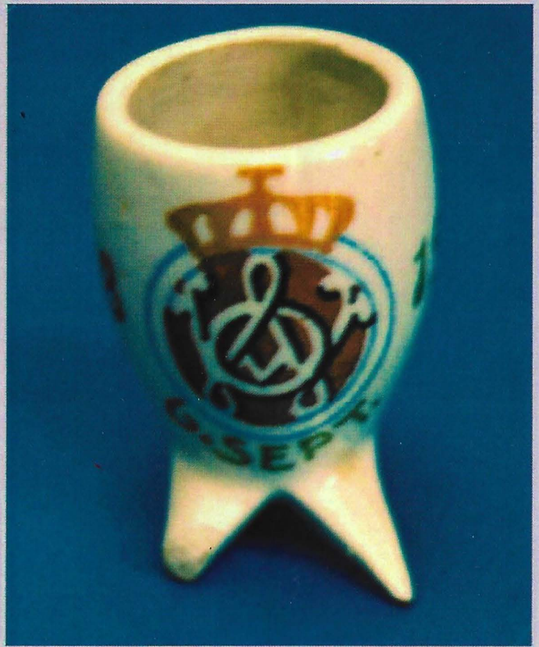
Een gietpijp met de verstrengelde letters WvO en de tekst 6 sept. 1898-1923 van Ivora. Zie pag. 74